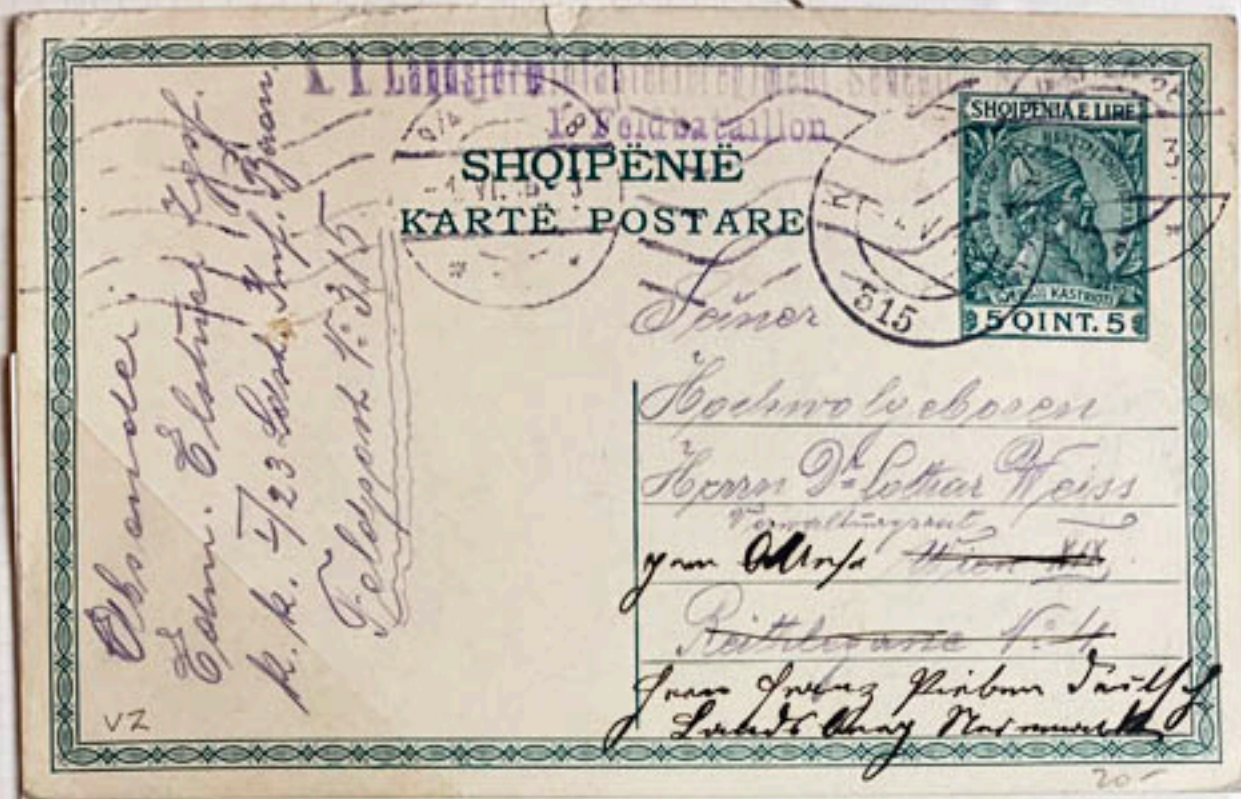
FIELD POST OFFICE 315 (MAY 21, 1916)