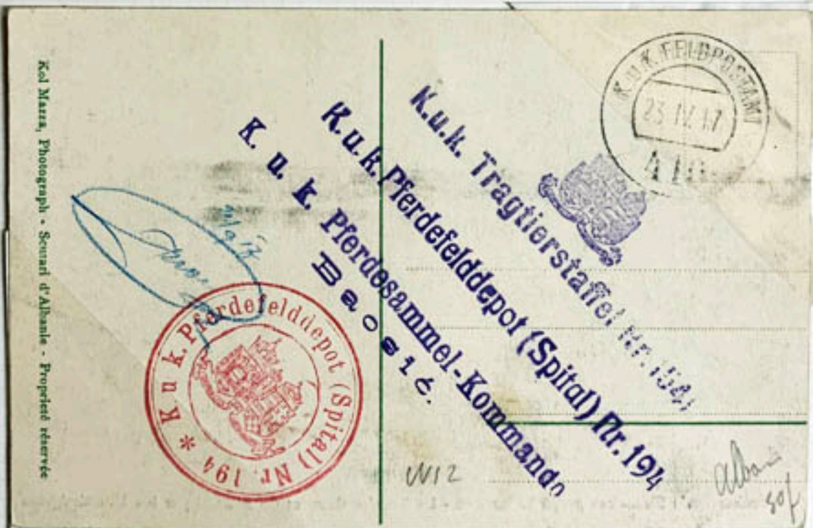
FELDPOSTANT 410 APRIL 23, 1917