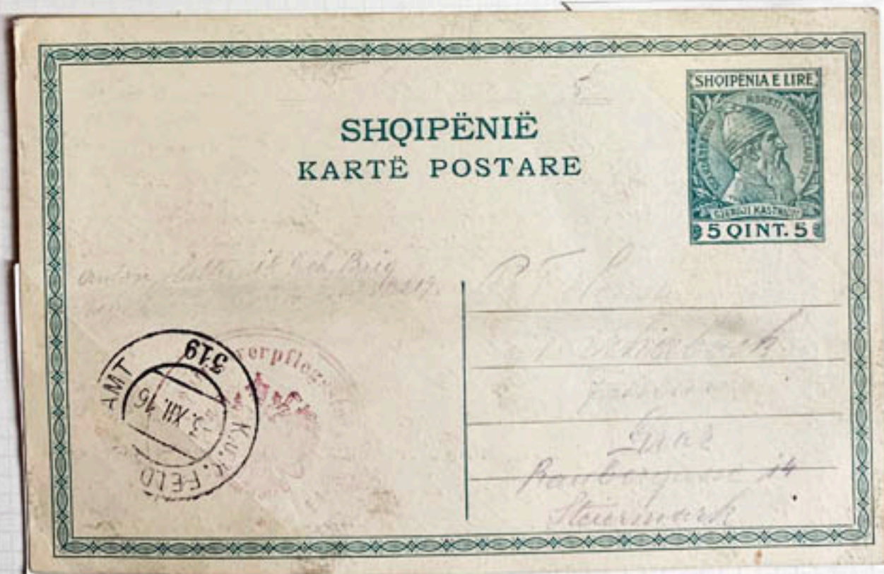
FIELD POST OFFICE 319 (DECEMBER 3, 1916)