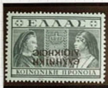
10c France Double